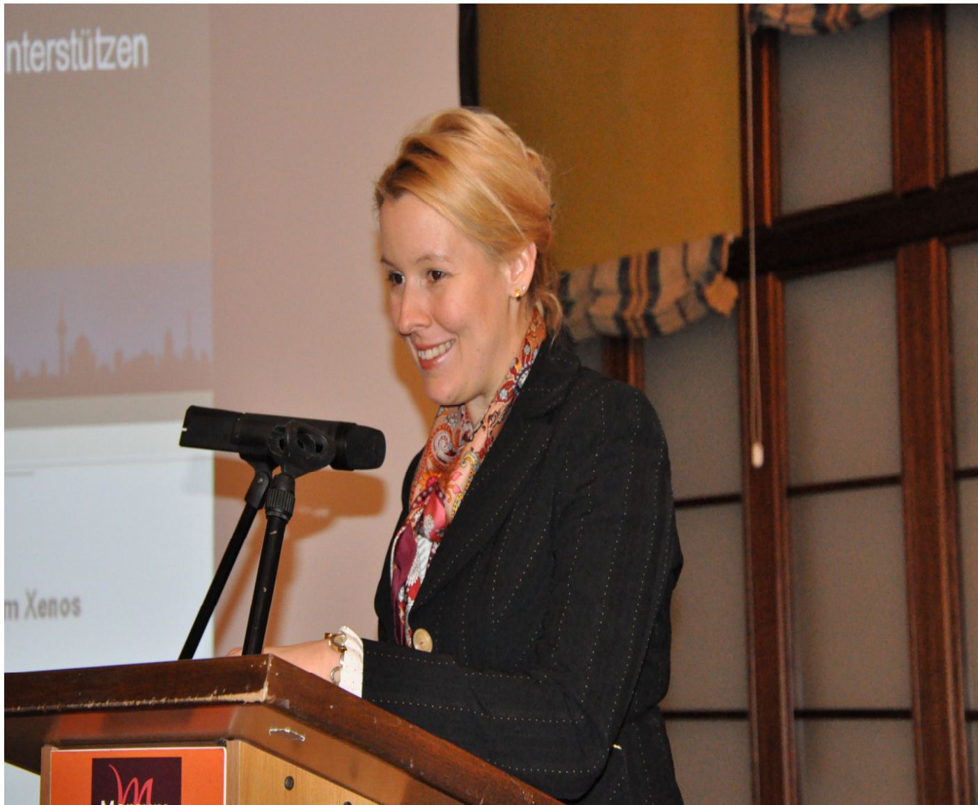
Dr. Franziska Giffey, Bezirksstadträtin für Bildung, Schule, Kultur und Sport im Bezirk Neukölln

Bezirksstadträtin Dr. Giffey, die das Projekt seit seiner Planung, noch als Europabeauftragte des Bezirks, unterstützt und begleitet hat, beglückwünschte den TUH dazu, dass es dem Projekt bei rund 70% der Teilnehmer gelungen ist, die Ausbildungsfähigkeit herzustellen und eine konkrete berufliche Perspektive zu erarbeiten.